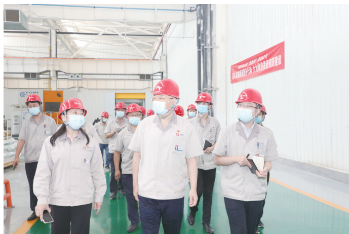
在新能源园区风电齿轮箱车间

9月8日,集团公司党委书记、董事长韩珍堂赴轨道公司、太重煤机、新能源公司走访调研,实地察看了项目最新进展情况,并围绕项目进度、设备管理等方面提出具体要求。